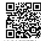
生物安全実践講習会HP.